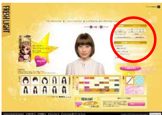
ボリューム、ポジションなどを微調整。