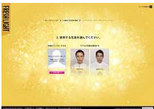
使用したい画像を選ぶ (携帯カメラやデジタルカメラからアップロード)