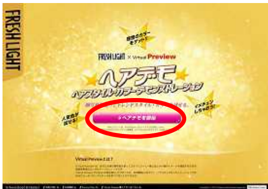
TOPの「ヘアデモを開始」をクリック。