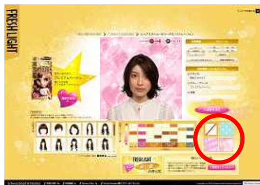
背景を選び、保存。 気に入った画像は携帯・PCアドレスに送信。 お友達にも送れます。