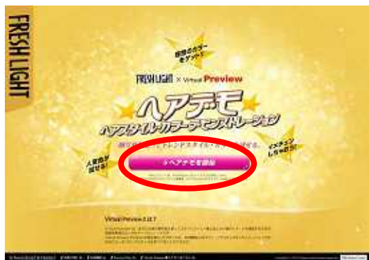
TOPの「ヘアデモを開始」をクリック。