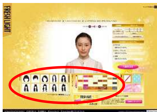
各項目から試したいスタイル・カラーを選ぶ。