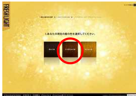
現在の髪色を選ぶ。